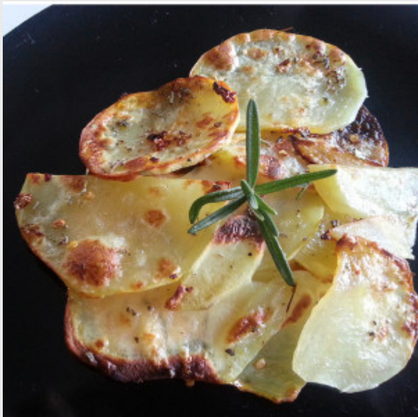
Salmone in crosta di patate

Buono, facile e veloce, questo secondo piatto è sicuramente la soluzione a cui ricorro quando ci sono ospiti inattesi in vista.