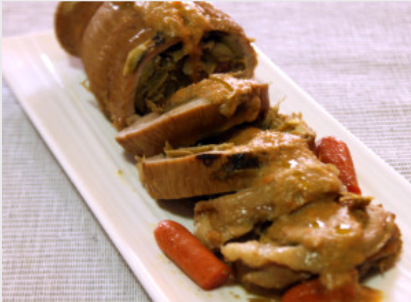
Rollè di vitello con carciofi e prosciutto cotto